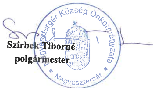
Szirbek Tiborné polgármester

Ez a rendelet 2023. szeptember 1-jén lép hatályba.